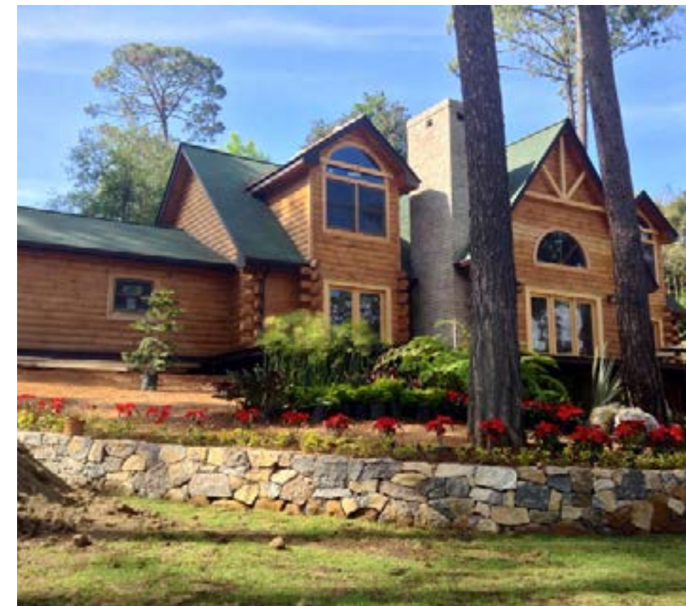
Inferior derecha. Diseño y construcción: Cabañas de México. Ubicación: Guasucaro, Michoacán. Año de construcción: 2019