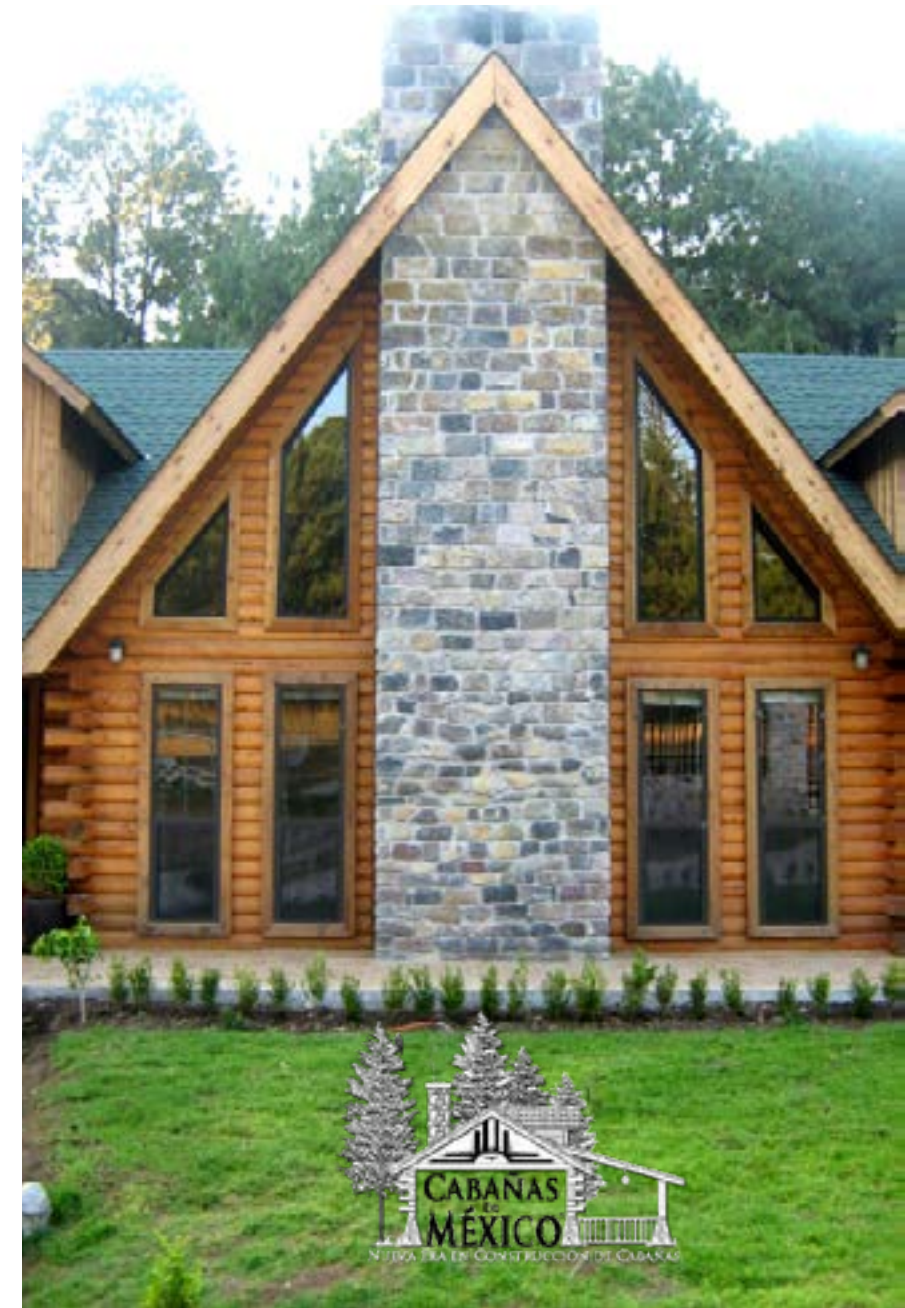
Arriba: Proyecto y construcción por Cabañas de México. Ubicación: Valle de Bravo, Estado de México. Año de construcción: 2009