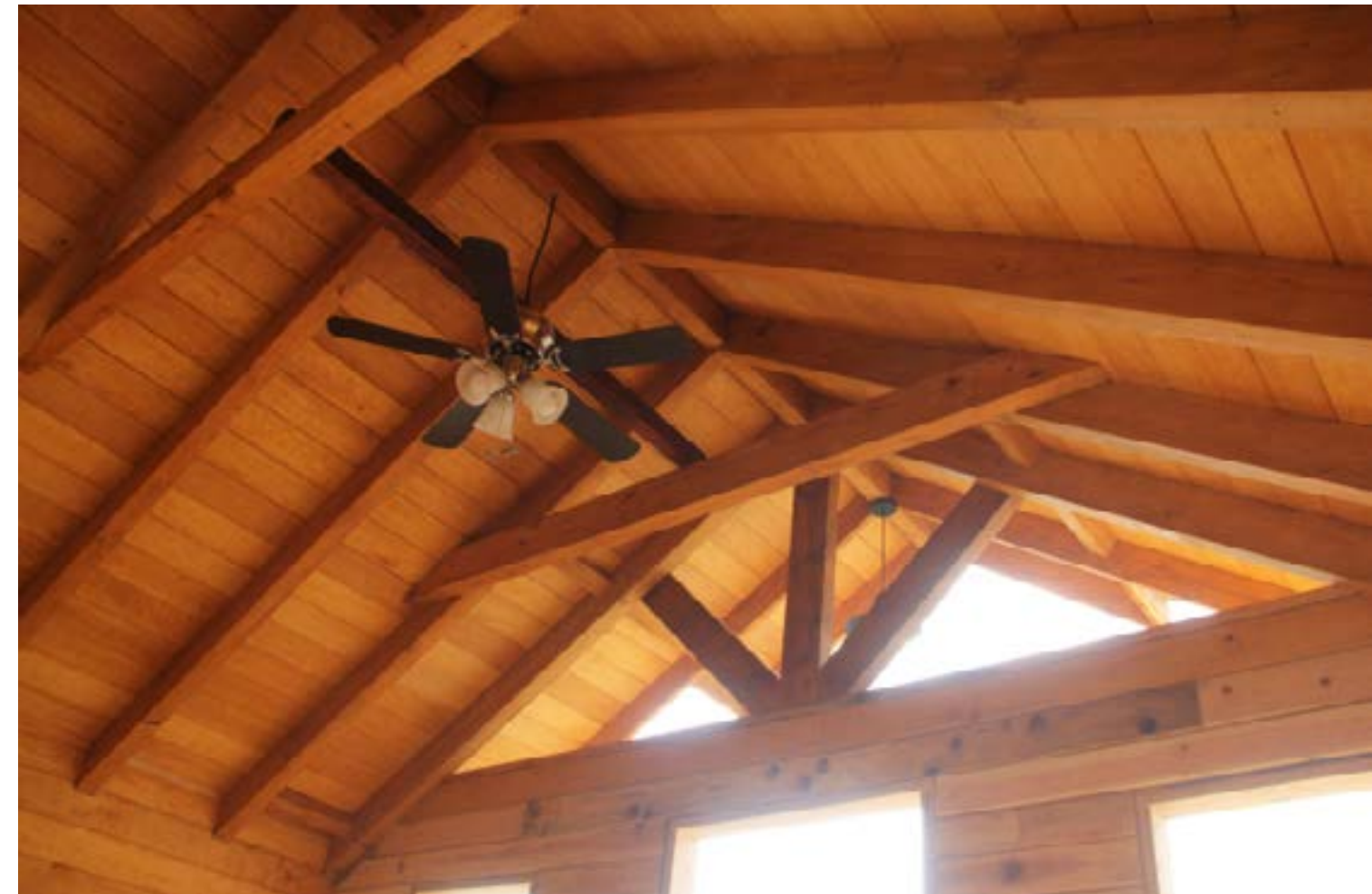
Izquierda. Diseño y construcción: Cabañas de México. Ubicación: Naucalpan, estado de México. Año de construcción: 2012